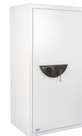
Office-Line 806, 816, 826 K