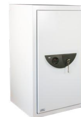
Office-Line 804, 814, 824 K