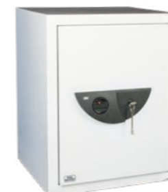
Office-Line 802, 812, 822 K