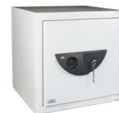
Office-Line 801, 811, 821 K