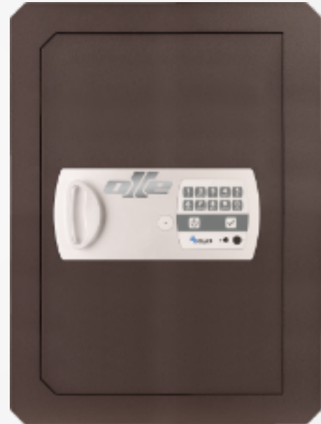
wall 1004-25 OCLUC