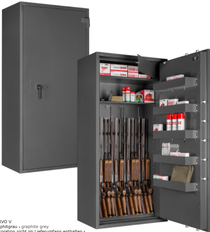
CERVO V Graphitgrau • graphite grey Dekoration nicht im Lieferumfang enthalten • decoration not included in the delivery

Waffenschrank, Grad I (EN 1143-1) Weapon safe, Grade I (EN 1143-1)