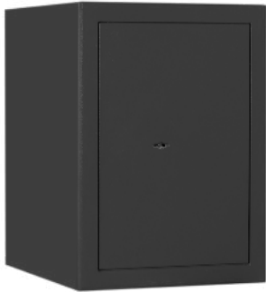
M 210 Graphitgrau • graphite grey