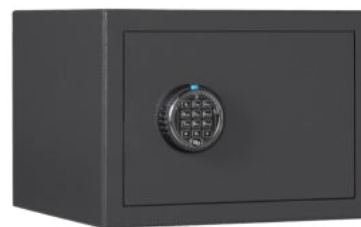
M 410 Elo Graphitgrau • graphite grey

Dekoration nicht im Lieferumfang enthalten • decoration not included in the delivery