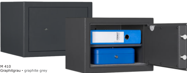
M 410 Graphitgrau • graphite grey