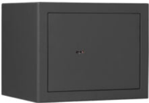
M 310 Graphitgrau • graphite grey