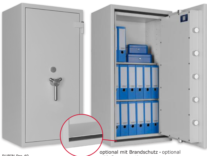
RUBIN Pro 40 Lichtgrau • light grey optional mit Brandschutz • optional with fire protection Dekoration nicht im Lieferumfang enthalten • decoration not included in the delivery