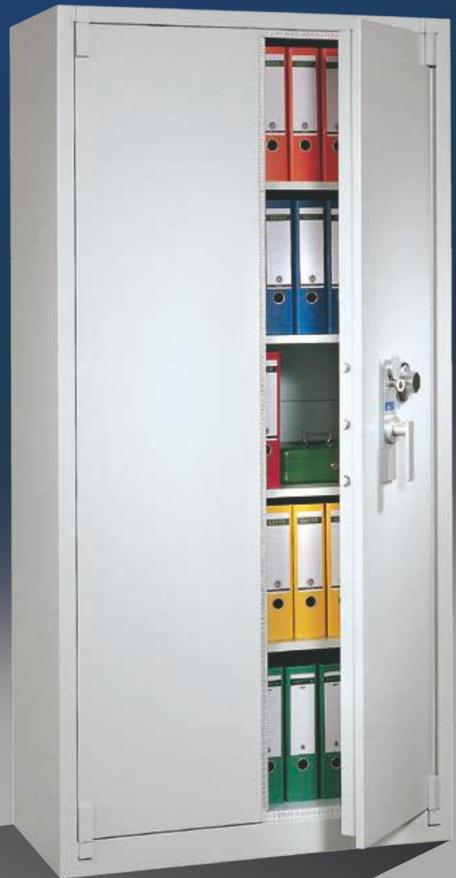
Abb.: BS 1100 (mit Sonderausstattung zusätzlichem ZKS)

Tür dreiwandig; Stahlschrank über alle Kanten gebogen und sorgfältig verschweißt