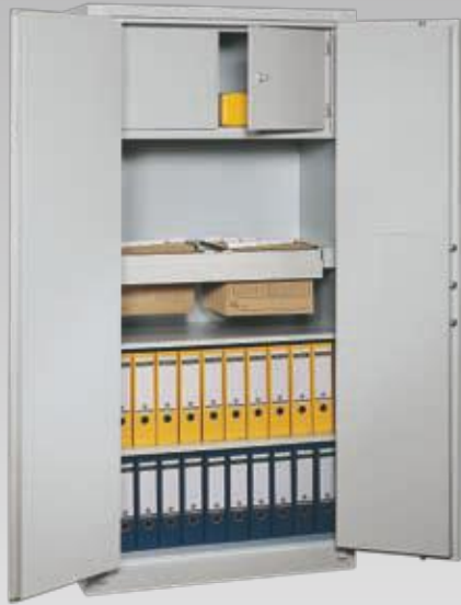
Abb.: BS 1100 (mit Sonderausstattung Innentresor und Teleskopauszug)