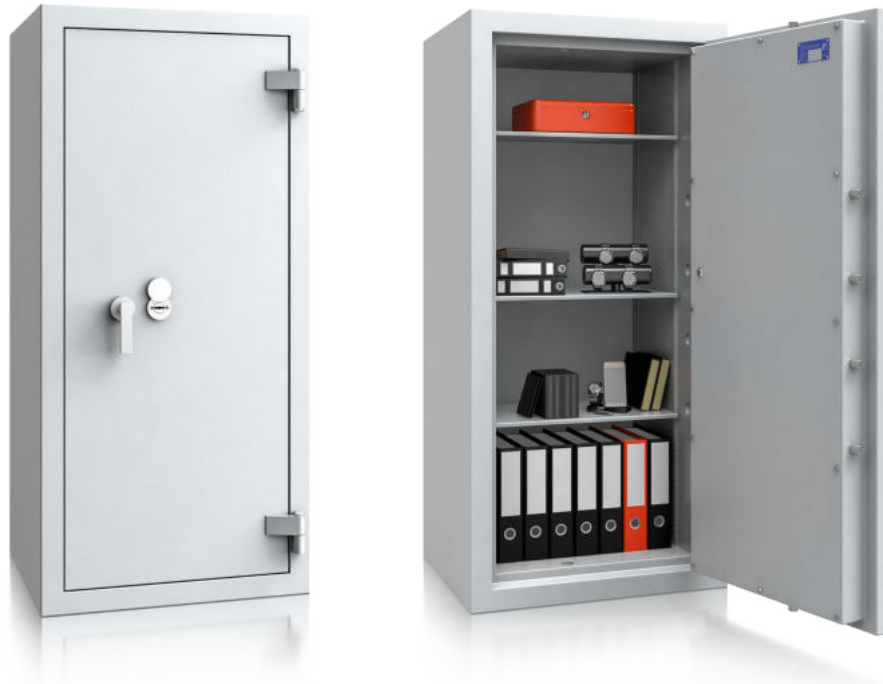
Modell EN 0-160