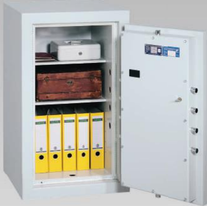
Abb.: EN 0-100