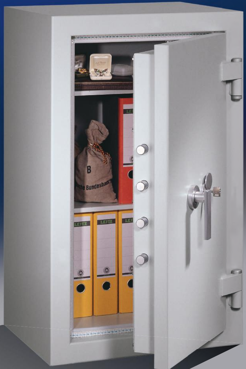
Abb.: EN 0-100