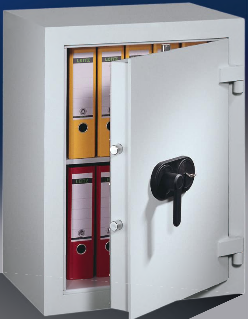
Abb.: EV 0-80