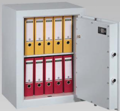
Abb.: EV 0-80