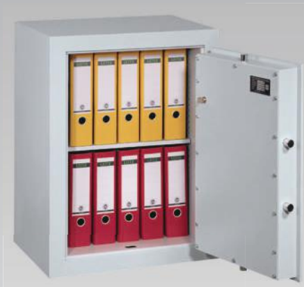
Abb.: EV 1-80