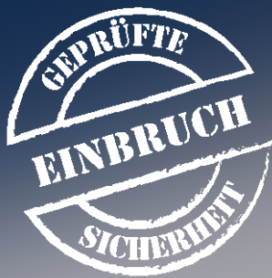
Abb.: EV 1-100