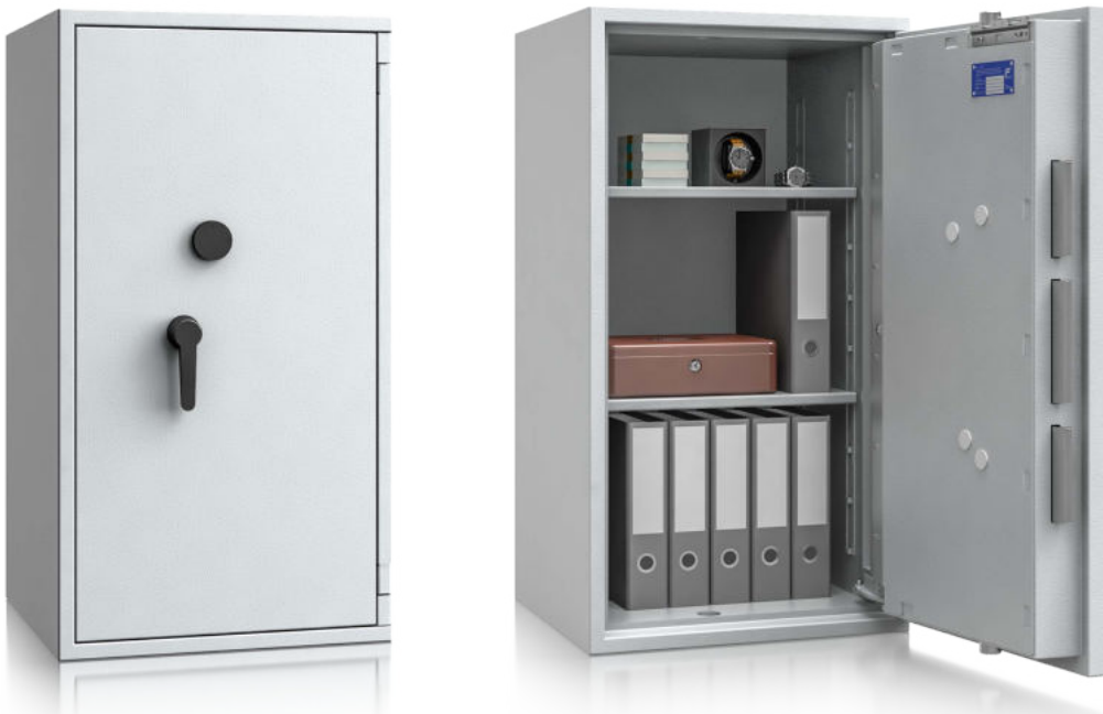
Modell EW II-105