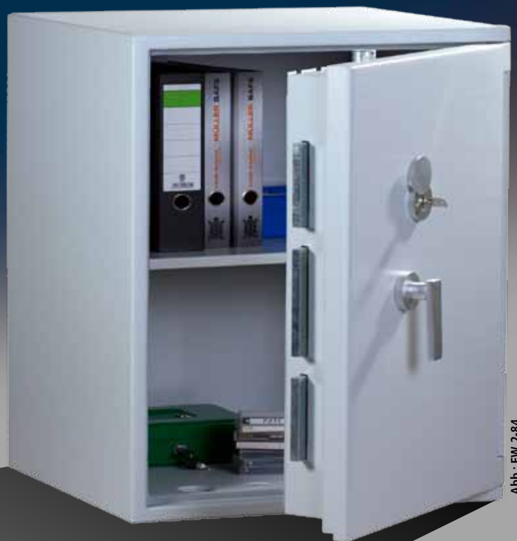
Abb.: EW 2-84