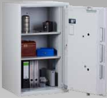
Abb.: EW 2-105