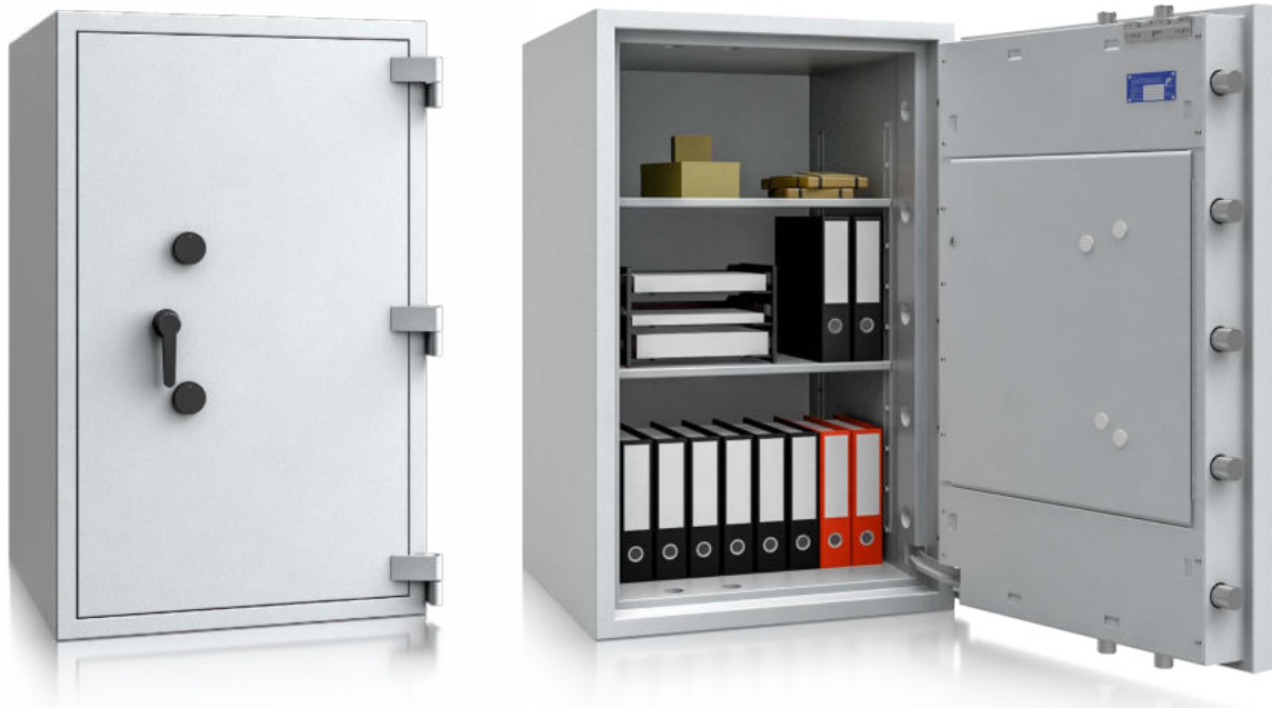
Modell EW V-124