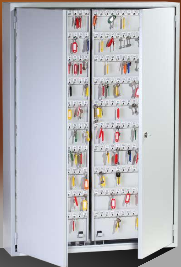
Abb.: GG 780

Schlüsselleiste verstellbar, mit stabilen Metallhaken