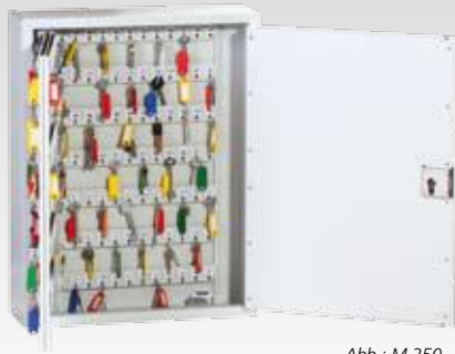
Abb.: M 250 mit Vorrichtung für Profilhalbzylinder