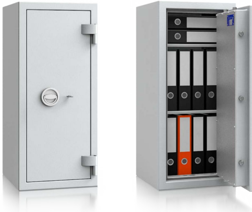
Modell GA 95