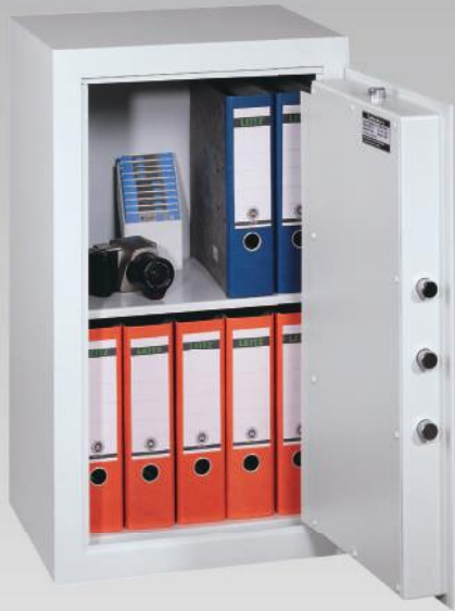
Abb.: MLE 81