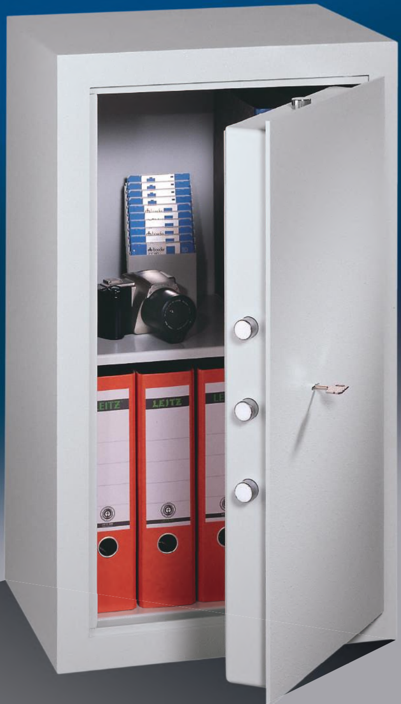
Abb.: MLE 81