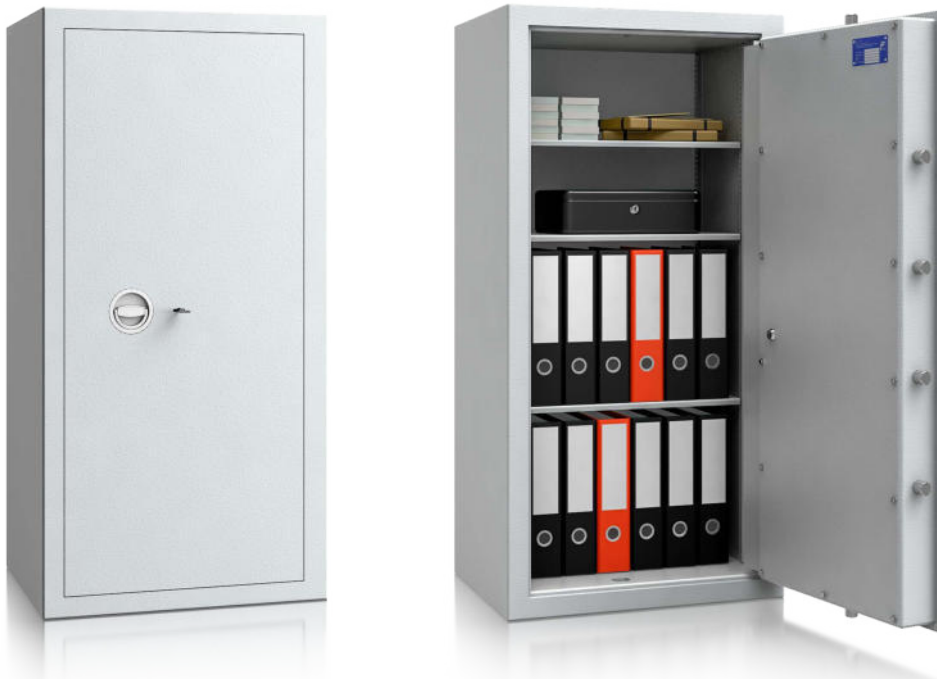
Modell MNO 12