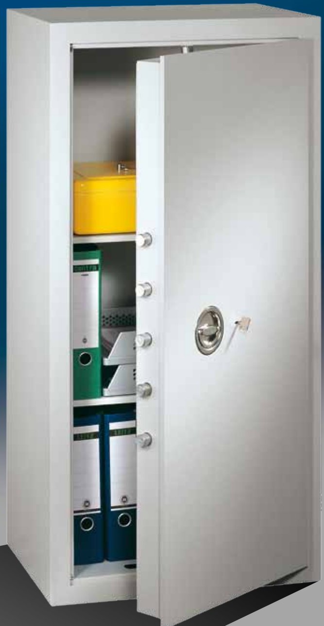
Abb.: MVO 12