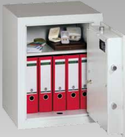
Abb.: MVO 6