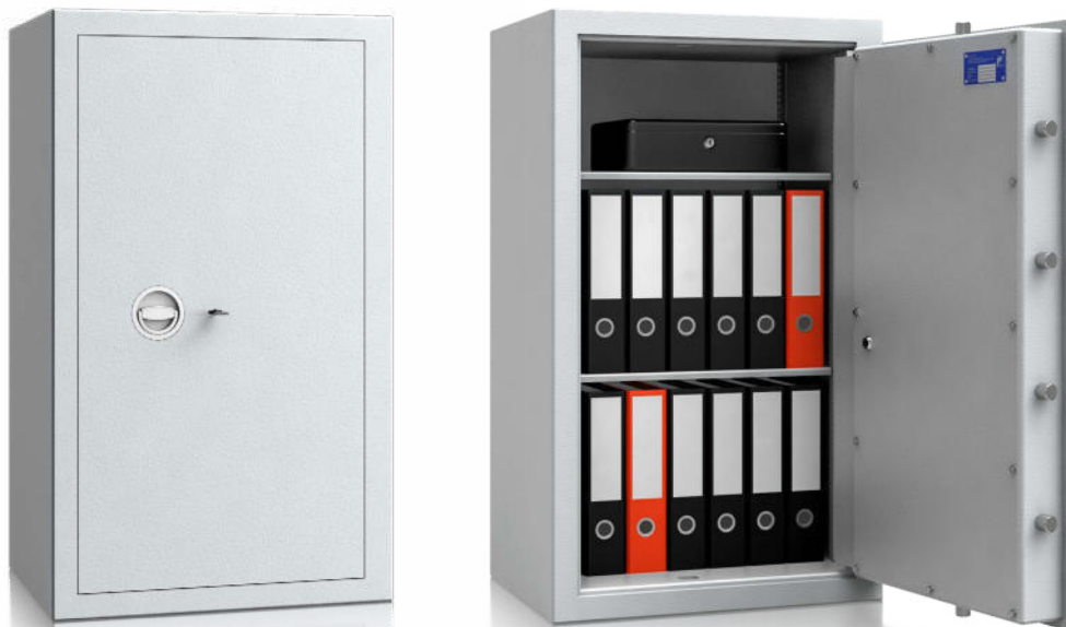
Modell MVO 10