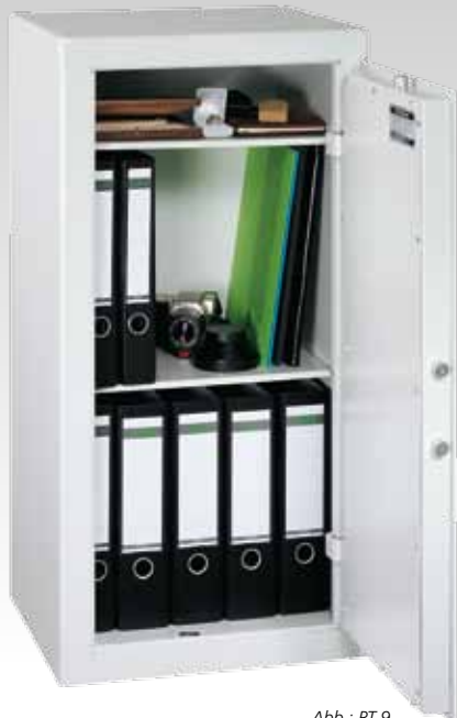
Abb.: PT 9