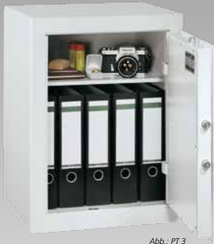
Abb.: PT 3