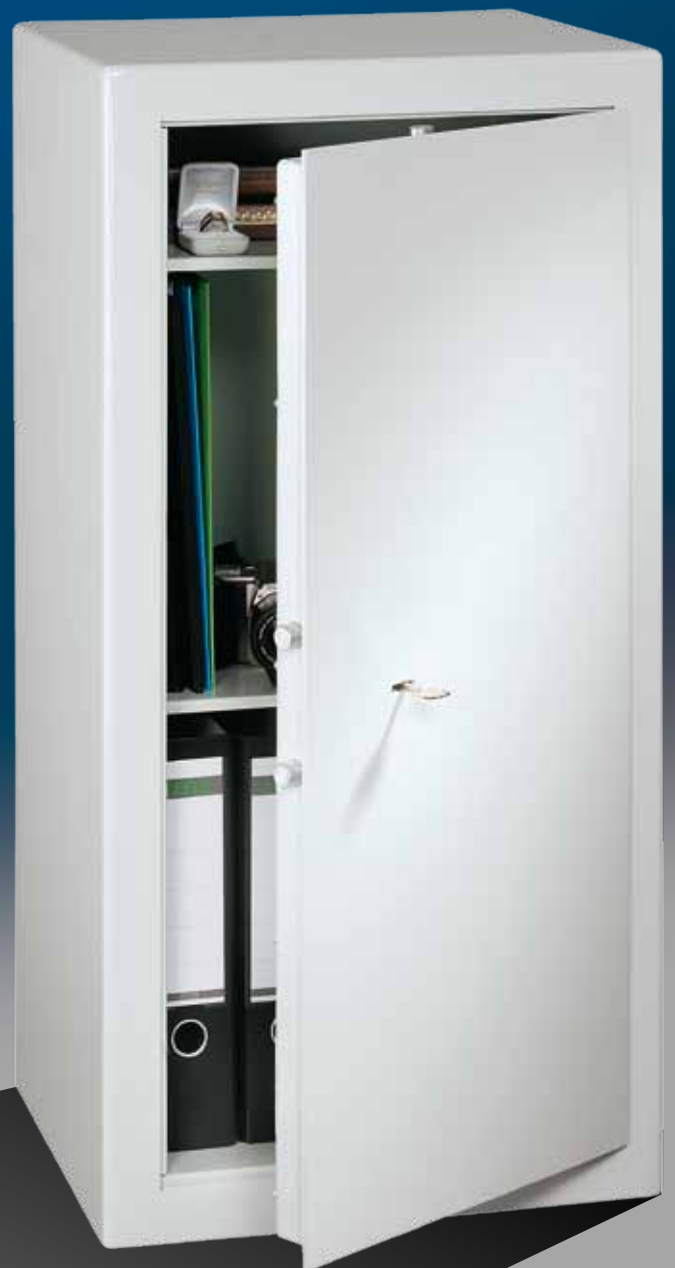
Abb.: PT 9