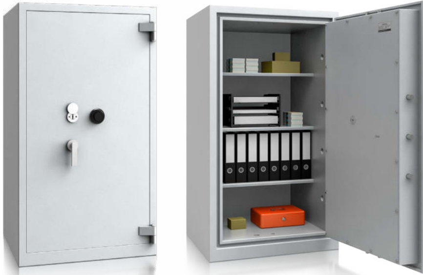
Modell SG II VS 1