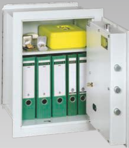
Abb.: VNO 6