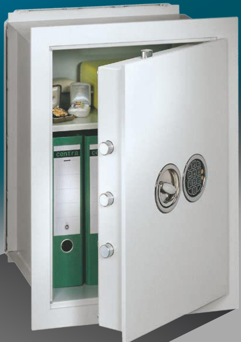
Abb.:VNO 6 (mit Sonderausstattung EZ LG Basic versenkt)