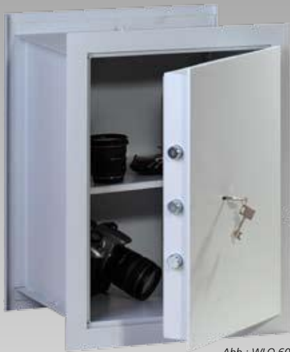
Abb.: WLO 60