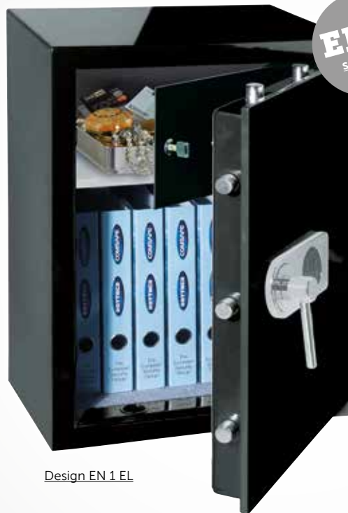
Design EN 1 EL