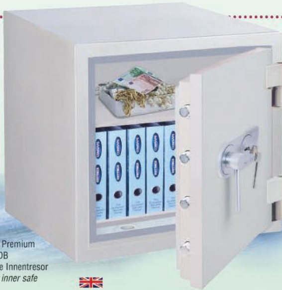
Opal-Fire Premium OPD-65 DB Abb. ohne Innentresor / without inner safe