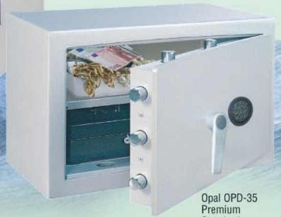
Opal OPD-35 Premium Standard