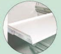
Teleskop-Fachboden Telescopic shelves to pull out