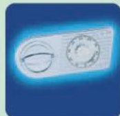
a) MC OPD-55 Mechanisches Zahlenkombinationsschloss EN 1300 Klasse A. a) MC OPD-55 Mechanical combination lock EN 1300 Class A.