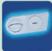
DB Standardschloss OPD-55 Doppelbart-Hochsicherheitsschloss EN 1300 Klasse A. DB Standard Lock OPD-55 High security double bitted key lock EN 1300 Class A.