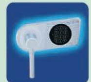
b) EL ab OPD-65 Elektronisches Sicherheitsschloss EN 1300 Klasse B (ohne Revision) mit 9 Volt Blockbatterie inklusive. b) EL of OPD-65 Electronic security lock with EN 1300 Class B (without revision) incl. 9 Volt block battery.