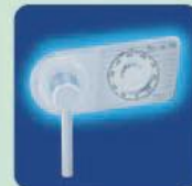
a) MC ab OPD-65 Mechanisches Zahlenkombinationsschloss EN 1300 Klasse A. a) MC of OPD-65 Mechanical combination lock EN 1300 Class A.