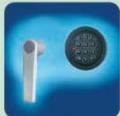
DB Standardschloss OPD-35 und OPD-45 Doppelbart-Hochsicherheitsschloss EN 1300 Klasse A. DB Standard Lock OPD-35 and OPD-45 High security double bitted key lock EN 1300 Class A.