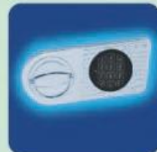
b) EL OPD-55 Elektronisches Sicherheitsschloss EN 1300 Klasse B (ohne Revision) mit 9 Volt Blockbatterie inklusive. b) EL OPD-55 Electronic security lock with EN 1300 Class B (without revision) included 9 Volt block battery.