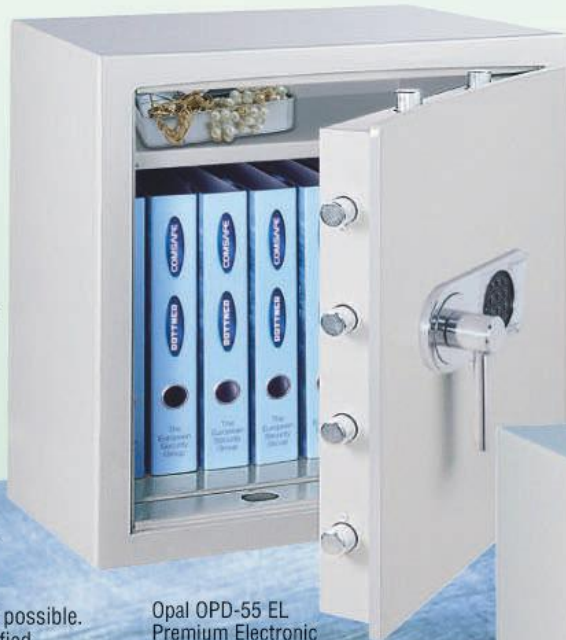
Opal OPD-55 EL Premium Electronic Abb. ohne Innentresor / without inner safe

SAFES LESS THAN 1000 KG MUST BE ANCHORED INTO A CONCRETE FLOOR.