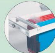
Teleskop-Hängeregister Telescopic filling frame for suspension