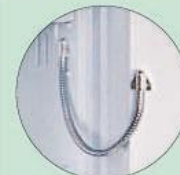
EMA-Vorbereitung EMA preparation

OPAL-Premium: EMA Vorbereitung möglich. OPAL-FIRE: EMA-Vorbereitung nicht möglich.