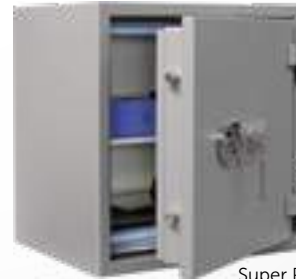
Super Paper 65