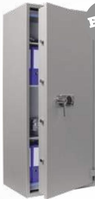
Super Paper 160 Premium mit EL Schloss

Detailskizzen für Ordner- einteilung finden Sie auf www.rottner-tresor.at