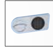
Muschelgriff EL Sicherheits- schloss