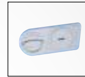
Muschelgriff DB Standard- schloss