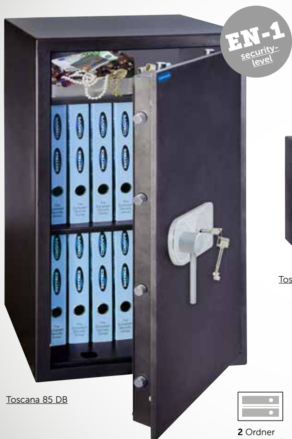
Toscana 85 DB