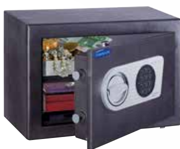
Toscana 26 EL