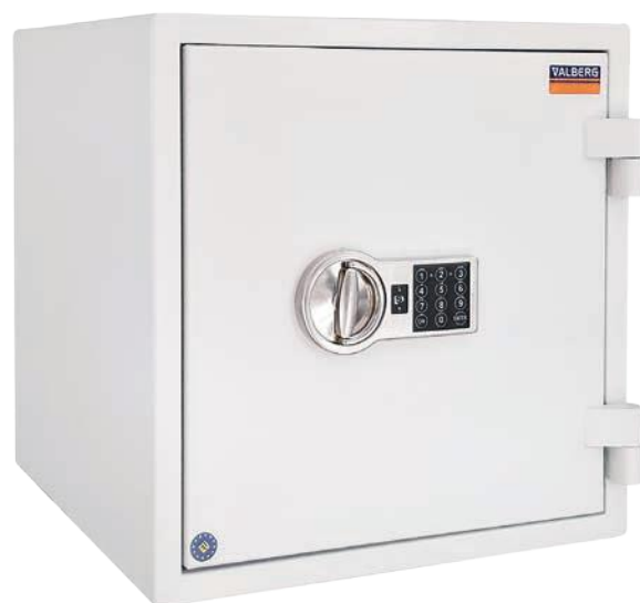
Valberg BRF 46