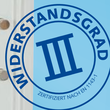
SE III LFS 103/0

Der Versicherungsschutz verdoppelt sich bei Anschluss an eine VdS-anerkannte Einbruchmeldeanlage (EMA). Deckungsgrenze in Abstimmung mit dem Sachversicherer. Direktionsanfrage!