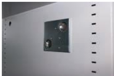
Vorbereitung für eine Alarmkomplettausstattung (Sonderausstattung)