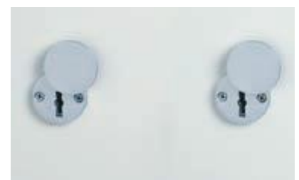
Grundausrüstung: 2 x DSS mit Schlüsselrosette (Standard)