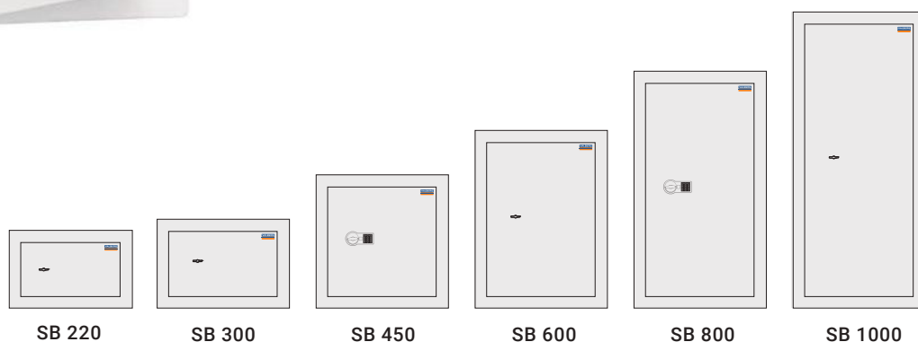
Valberg SB 450